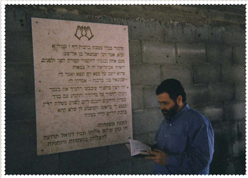
ליד הלוח שהוצב בציון רבי ישמעאל בן אלישע, ועליו חקוקות מילות "תניא"